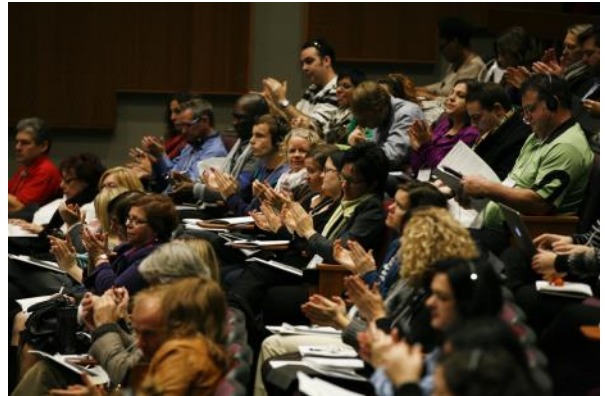
Deux conférences et deux ateliers étaient offerts aux 200 participants.

80% d'entre eux disent avoir appris quelque chose qui améliorera la situation pour les jeunes victimes d'intimidation à leur école.