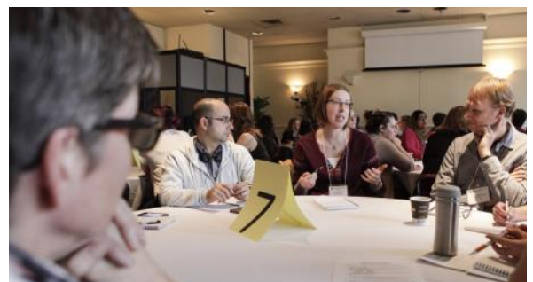
Un des 20 groupes de discussion

Après les ateliers, 30 minutes étaient donc consacrées à la discussion. Guidés par des animateurs experts sur le sujet, les participants ont donc pu réfléchir en groupe aux solutions les plus appropriées pour leur milieu