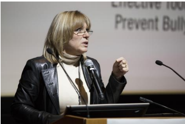
Francine Charbonneau , Ministre de la Famille, s'adressant aux participants lors de la conférence de clôture.

Pour sa deuxième formation en prévention de l'intimidation, le Réseau des donateurs pour la paix a choisi de répondre à ce besoin en offrant des outils concrets et basés sur la recherche au personnel scolaire.